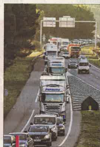
Une voie rapide de bus va sortir de terre sur la bretelle d'accès de l'A51 sud (en provenance de Marseille).

res. Cette même route, depuis et vers Luyes, cumule un trafic de 7 100 véhicules/jour. La bretelle de sortie Luyes, sur l'A51, est empruntée par 6 600 automobilistes. Le soir, 7 400 repartent vers Marseille par l'autoroute. Depuis et vers Aix, le flux des deux bretelles d'accès varie de 8 300 à 9 200 voitures. Preuve qu'avec ou sans Arena, il était grand temps d'agir.